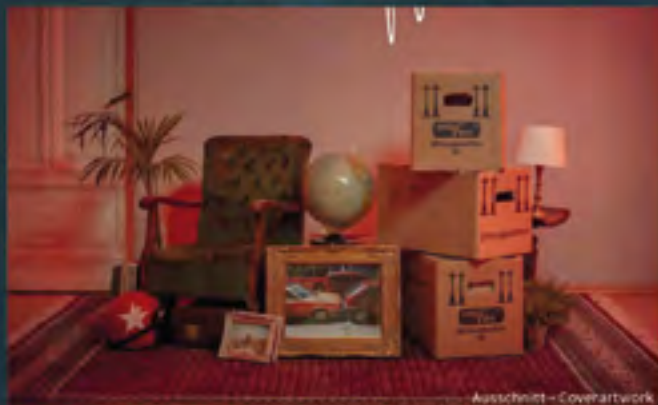
Ausschnitt – Coverartwork

Mit „Ende Offen“ erscheint nicht nur das dritte Album der Alex Mofa Gang , sondern auch der abschließende Teil ihrer Trilogie „Die Reise zum Mittelmaß der Erde“. Wir haben in die zwölf Songs reingehört und mal wieder versucht, das Ganze in Worten zu fassen.